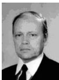
Болотин Владимир Васильевич 1926-2008