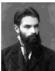
Ляпунов Александр Михайлович 1857-1918