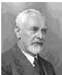
Прандтль Людвиг L. Prandtl 1875-1953