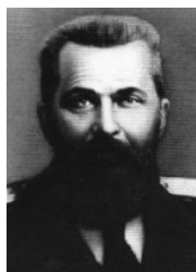
Бубнов Иван Григорьевич 1872-1919