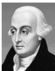
Лагранж Жозеф Луи J.L. Lagrange 1736-1813