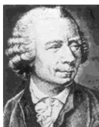
Эйлер Леонард L. Euler 1707-1783