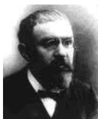
Пуанкаре Анри H. Poincaré 1854-1912