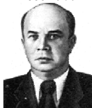
Четаев Николай Гурьевич 1902-1959