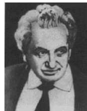
Карман Теодор Th. von Karman 1881-1963