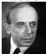
Мизес Рихард R. von Mises 1883-1953