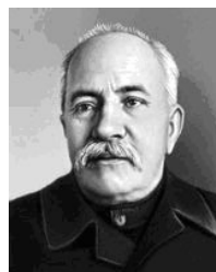
Динник Александр Николаевич 1876-1950