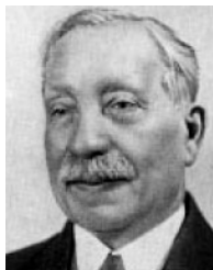
Галеркин Борис Григорьевич. 1871-1945